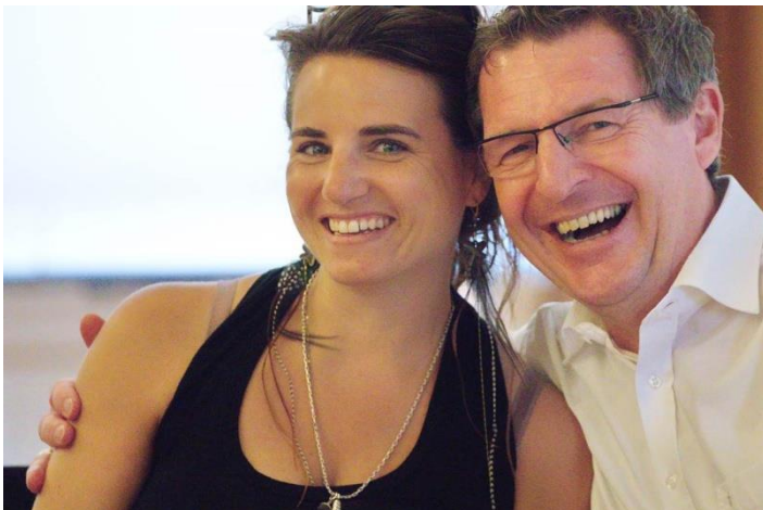
des Amtsgerichtes Mosbach, Hirschhorn