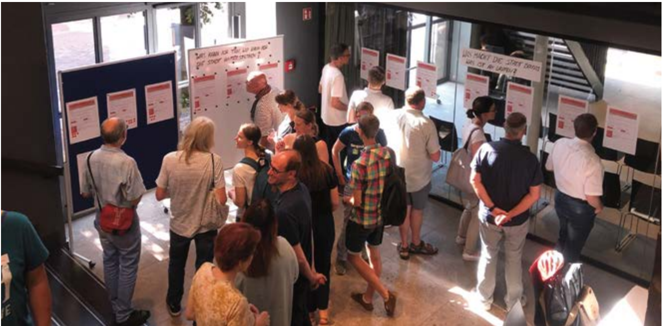
➔ Start der Workshopreihe am 23. Juni 2023

terinnen und Vertretern der Wirtschaft die von der Stabsstelle erarbeiteten ersten Maßnahmevorschläge für ein Klimaschutzkonzept präsentiert wurden.