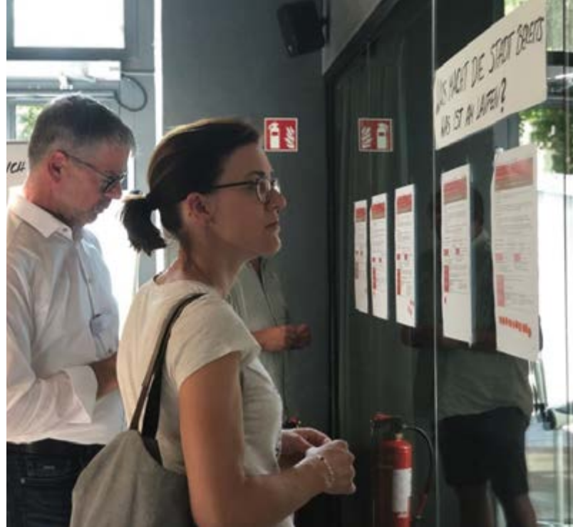
Ergebnisse der Thementische